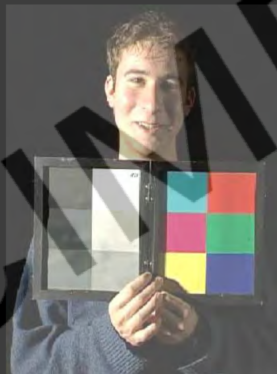
- dense 17 17 17