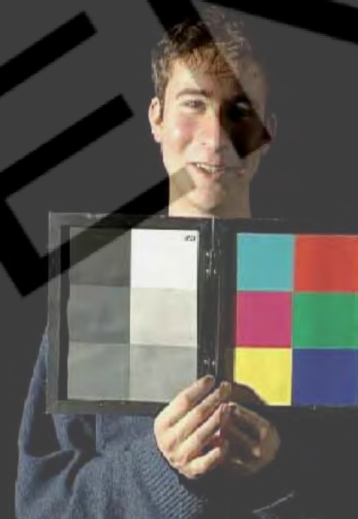
+dense 33 33 33

1 pt étalonnage = 0,025 LOG L et densité ( \approx 1/12^e IL) 4 pts étalonnage = 0,10 LOG L et densité ( \approx 1/3^e IL) 12 pts étalonnage = 0,30 LOG L et densité ( \approx 1 IL)