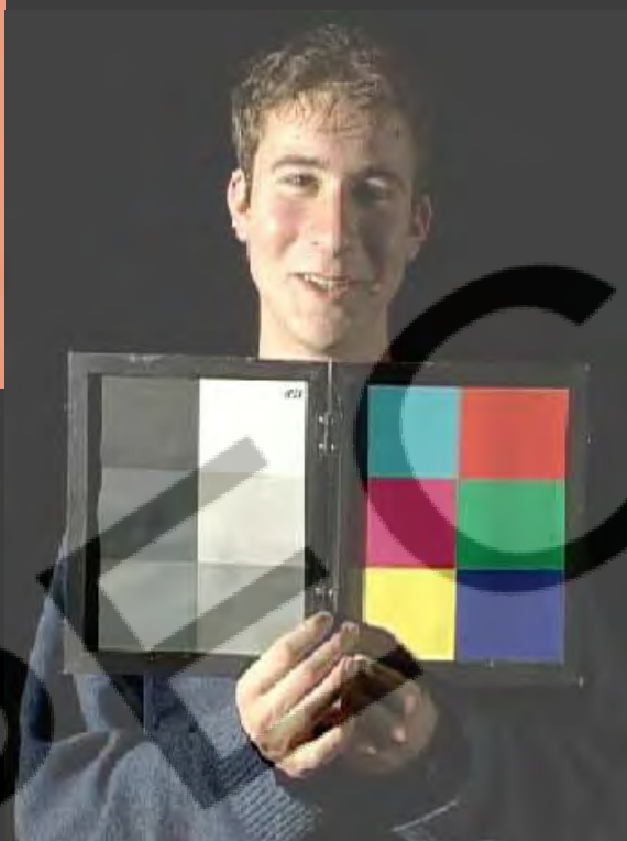
25 25 25