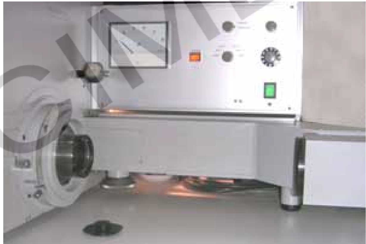
Banc FTM chez Panavision